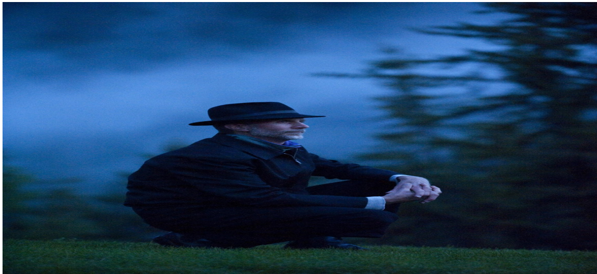
<p>John Luther Adams. </p>